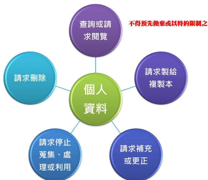
圖二：個人資料之當事人所擁有之權利

除了蒐集個資必須符合特定目的，蒐集者必須盡到告知義務外，個資當事人也有可行使之權利，包括了查詢、修改、補充個資，要求提供個資副本、要求停止蒐集、處理、利用個資，或者要求直接刪除個資，而且這些權利是不得被事先要求放棄或以合約限制的(見圖二)。