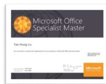
微軟 MOS 國際認證電子證書樣式